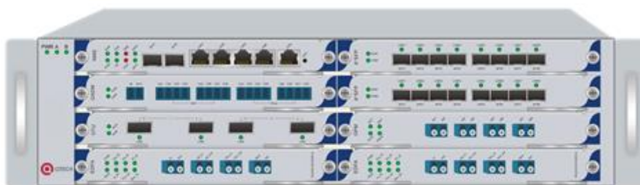
Рисунок 1. Вид спереди

QWM-8000-2.5U/8-ACDC — это высокопроизводительная платформа нового поколения, подходящая для построения магистральных, зоновых, местных Metro Ethernet-сетей. Платформа удовлетворяет требованиям, предъявляемым к решениям задач по оптическому уплотнению для провайдеров, дата-центров, государственных учреждений, предприятий топливно-энергетического комплекса. Оборудование применимо для организации передачи данных по одному оптическому волокну с использованием EDFA-усилителей с blue/red-фильтрами.